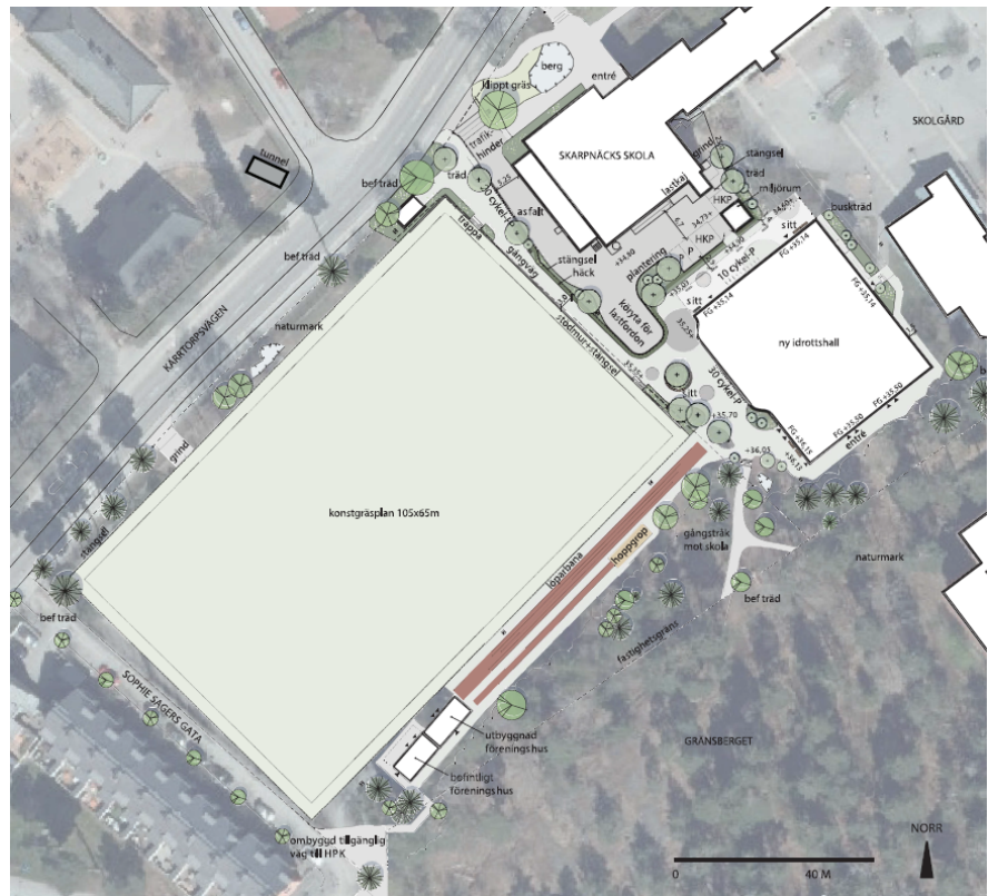
Illustration över planerad utformning av Gränsbergets bollplan, rakbanor och hoppgröp samt servicebyggnad (idrottshallen och dess intilliggande ytor är inte uppdaterat i denna illustration).

Förvaltningarna ämnar utveckla Gränsbergets BP från att vara en grusplan till att bli en fullstor 11-spels konstgräsplan med underliggande ispist på del av bollplanen samt att tillskapa en intilliggande rakbana och hoppgröp. Utvecklingen av bollplanen innebär att anläggningen kommer kunna nyttjas för föreningsidrott och skolidrott.